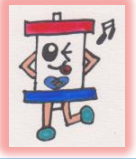
リハビリ中 ダイアイザ-のダイちゃん

初日は「長いね」「筋肉痛になったよ」と言われていたのですが、約2ヶ月経過した今、「もうちょっと長くても良いね」「家でも運動しよう」と嬉しい言葉も頂いております。皆さんもおすすめの曲、思い出の曲がありましたらスタッフまで声をかけて下さい。お待ちしております。